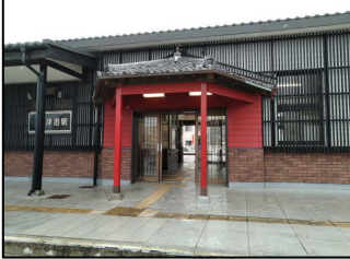
撮影ポイント CP1 大津港駅

写真撮影ポイント 1、2、3、1 又は 1、3、2、1 CP1 大津港駅東口 CP2 五浦海岸展望慰霊塔 CP3 大津新橋欄干アート 下流側